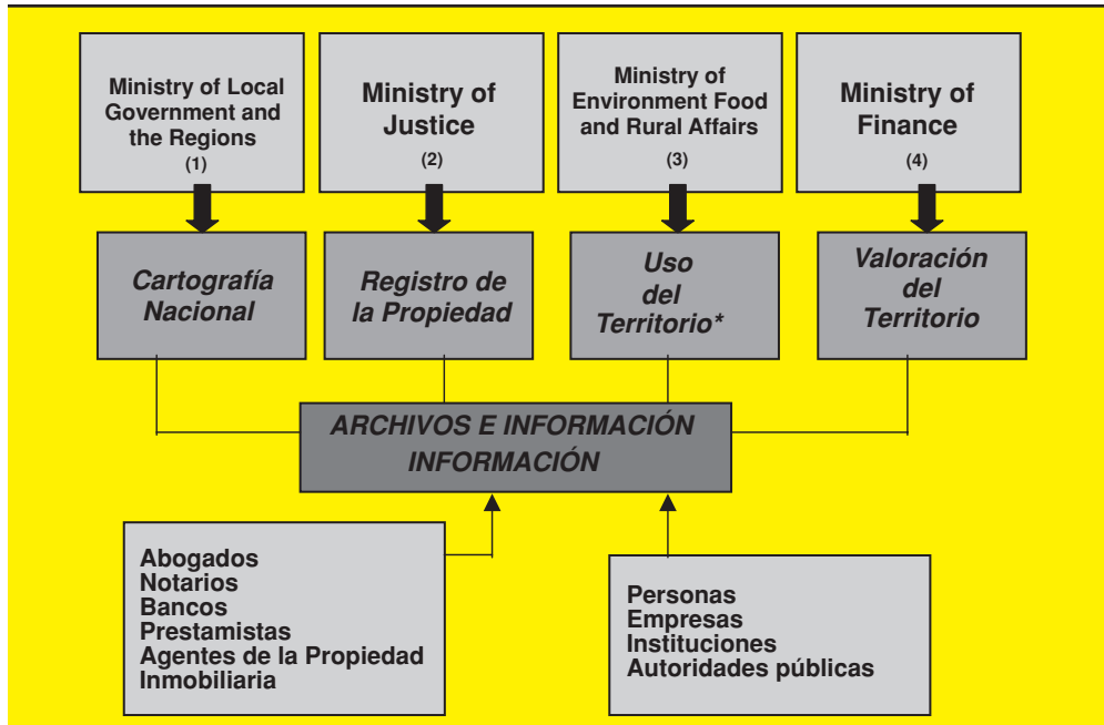
Gráfico 1 Estructura de la Administración del Territorio en Inglaterra y Gales

(1) Ministerio de la Administración Local y las Regiones.